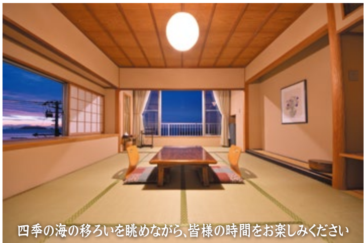
四季の海の移ろいを眺めながら、皆様の時間をお楽しみください