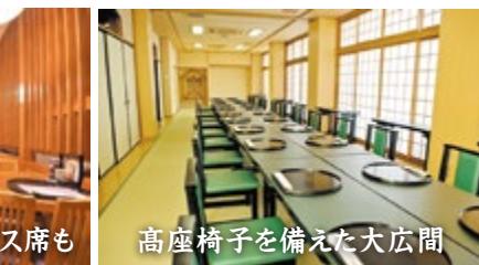
高座椅子を備えた大広間