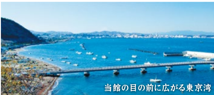
当館の目の前に広がる東京湾