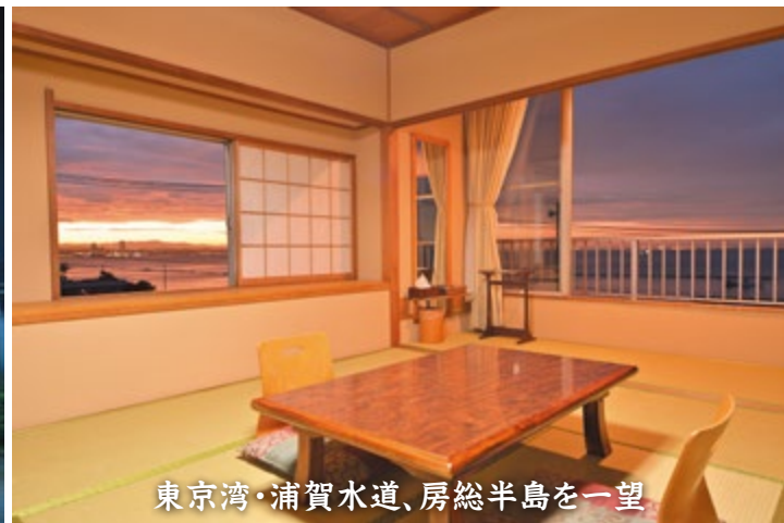
東京湾・浦賀水道、房総半島を一望