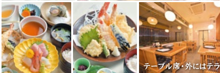
テーブル席・外にはテラス席も

全室オーシャンビュー 昭和37年の創業以来、ずっと変わらぬやすらぎをご提供しています。客室は全部で10室。全室が海に面しています。 春はお花見、夏は海水浴、秋は美術館に公園散策、冬は海釣り、それぞれの季節に応じた横須賀の楽しみ方で、お客様をご案内いたします。